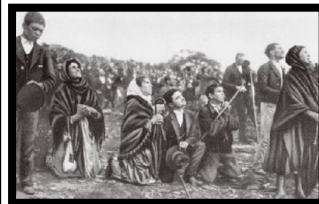
La multitud mirando el Milagro del Sol, ocurrido durante las apariciones de nuestra Señora de Fátima.

El Milagro del Sol fue un acontecimiento ocurrido el 13 de octubre de 1917, al que asistió una gran multitud que se había reunido cerca de Fátima, Portugal , en respuesta a una profecía hecha por tres pastores, que la Virgen María , llamada Nuestra Señora de Fátima , aparecería y realizaría Milagros en esa fecha. Los periódicos publicaron testimonios de reporteros y otras personas que afirmaron haber presenciado una actividad solar extraordinaria, tal como que el sol parecía "danzar" o zigzaguear en el cielo, dirigirse hacia la tierra y emitir luces multicolores y colores brillantes. Según estos informes, el evento duró aproximadamente diez minutos.